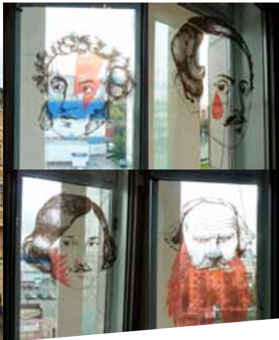
Современный городской дизайн Перми