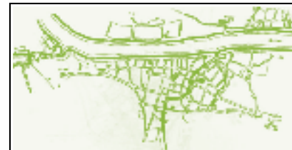
Старинный план города Устюжины Железнопольской.

Каждому желающему построить новый дом «Закон градский» предписывал заранее определить размеры будущего здания (§9). Если его длина превышала 12 стоп, то к нему не разрешалось прирезать свободное городское пространство. Категорический запрет на прирезку к частным дворам земли, отведенной под улицы и площади, зафиксирован в §34. В русской градостроительной прак-