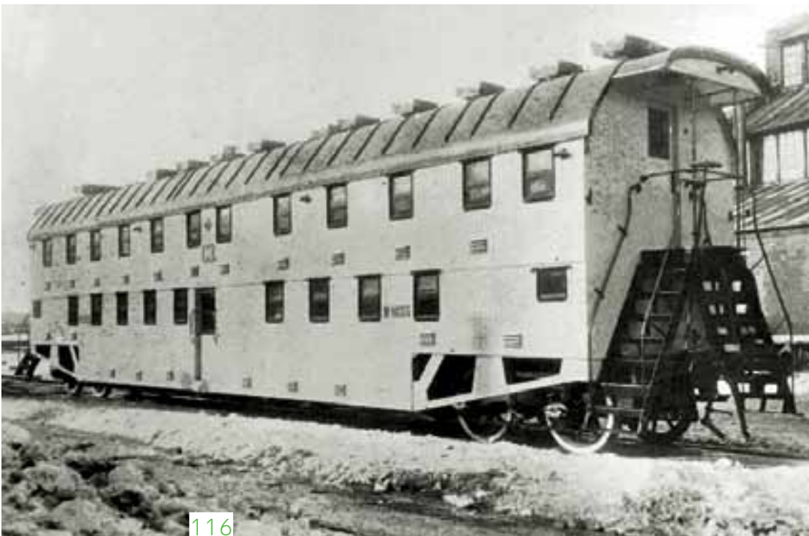
Карта переселения крестьян в азиатскую Россию во время Столыпинской реформы; двухуровневый «столыпинский» вагон для перевозки крестьян-переселенцев в Сибирь